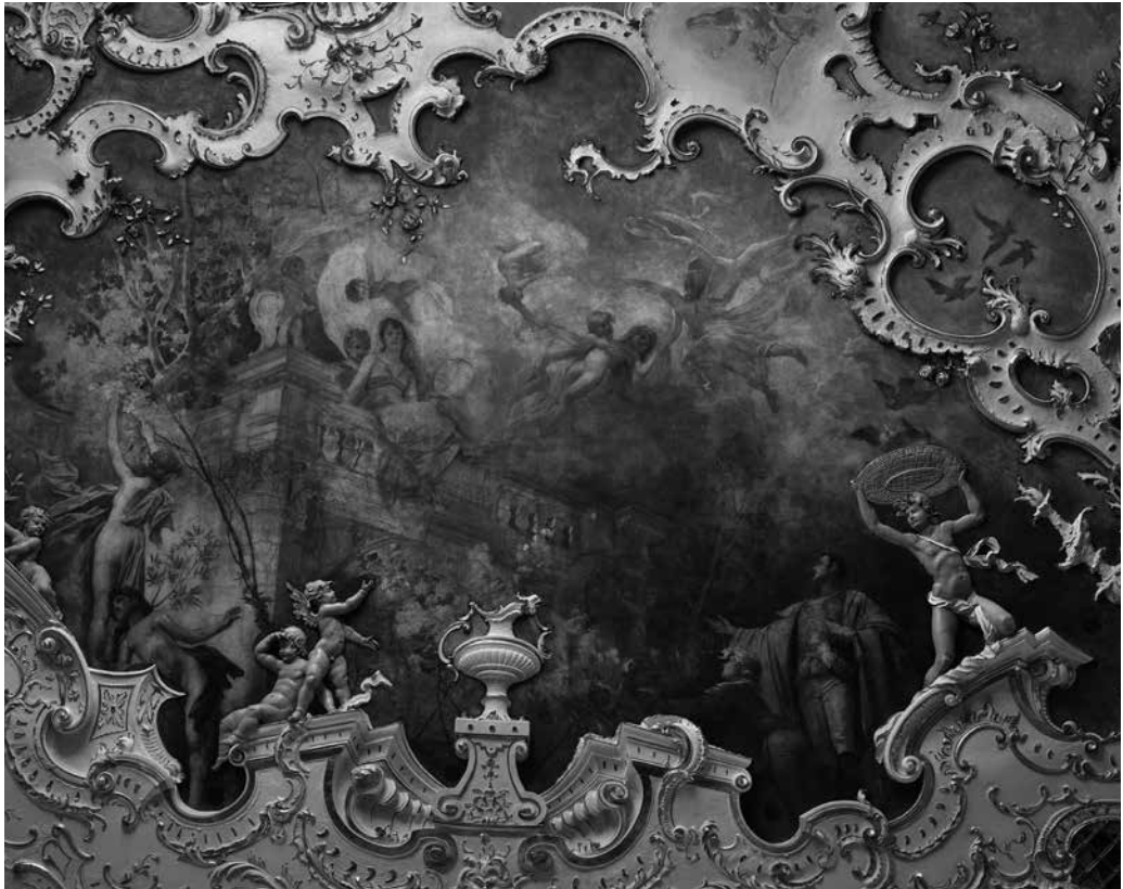
Eduard Veith byl nejen malíř, ale vytvářel také scénické výpravy. Je autorem stropní výmalby Státní opery. Znázorňuje jednotlivá období lidského života.