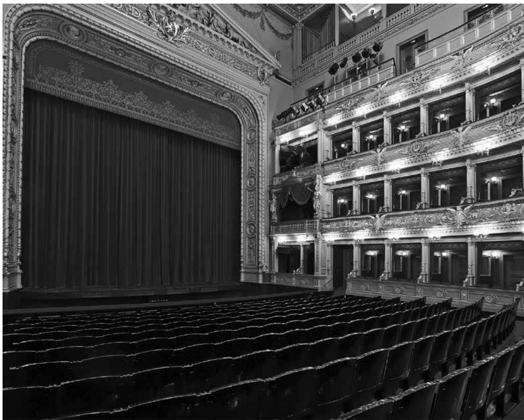
Hlediště Historické budovy je v době covidu bez diváků. Rekonstrukce v letech 1977 až 1983 vrátila do parteru typ původních křesel, jen před sto lety byla křesla menší.